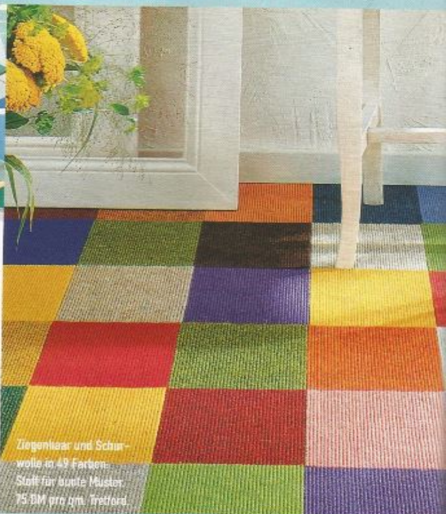
Ziegeltier und Schurwolle in 49 Farben. Stoff für bunte Muster. 75 DM pro qm. Tretford.